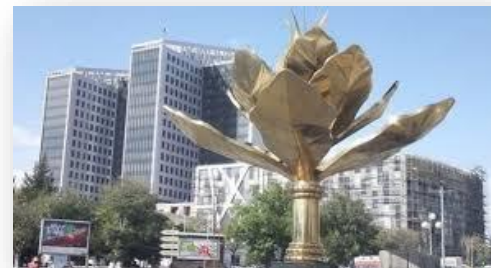
Ville de Sétif